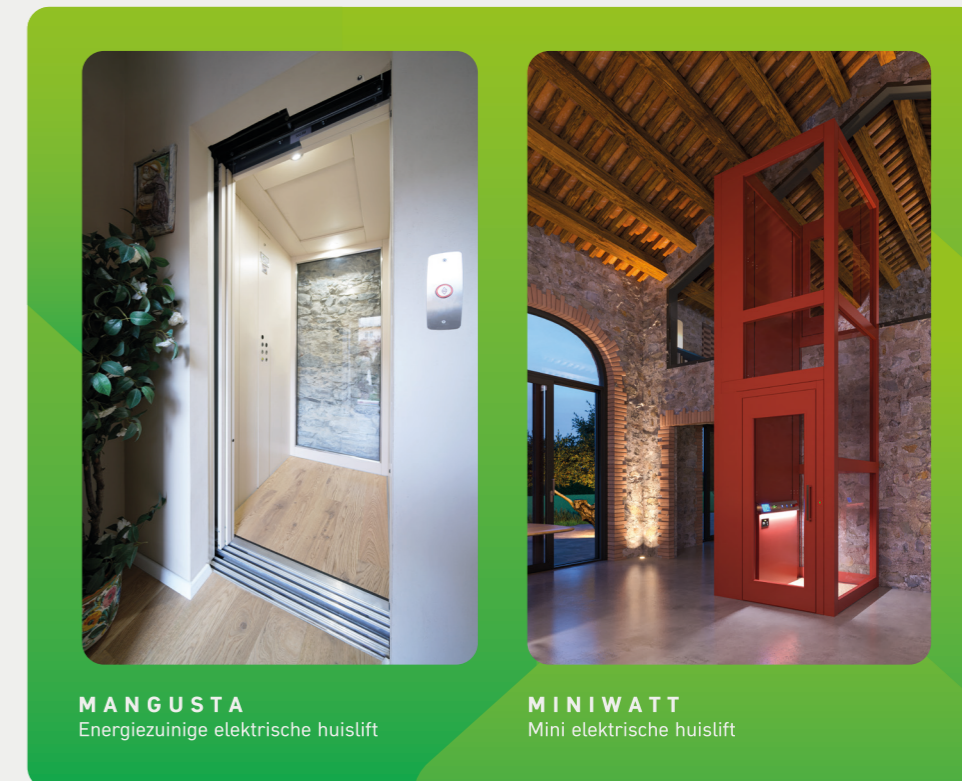
MANGUSTA Energiezuinige elektrische huislift