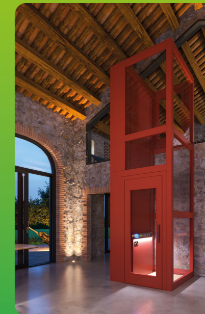
MINIWATT Mini elektrische huislift