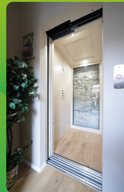
MANGUSTA Energiezuinige elektrische huislift